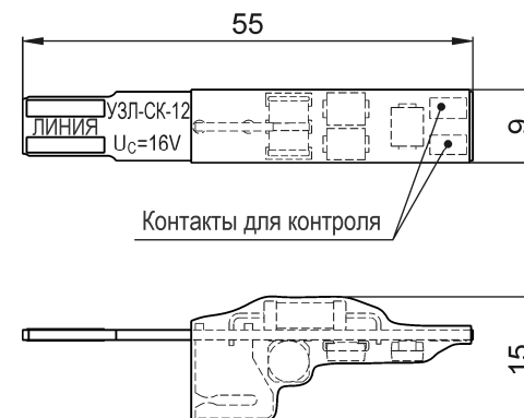
Рис.1 Габаритные размеры УЗЛ-СК-12 (УЗЛ-СК-24)

УЗЛ-СК-12 (УЗЛ-СК-24) должно быть обязательно заземлено, шина заземления для плитов типоряда «2» устанавливается в плинт со стороны линии. Устройство защиты необходимо установить в плинт таким образом, чтобы контакт шины заземления плинта входил в скобу заземления (см. рис.2).